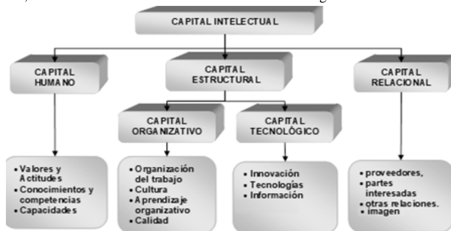
Figura 2. Estructura del modelo de capital intelectual propuesto

Precisamente, partiendo de estas premisas y en función del procedimiento propuesto en la figura 1, se desagrega el capital intelectual de la siguiente forma que se representa en la figura 2, la cual fue elaborada con base en modelos Navigator de Skandia e Intellectus.